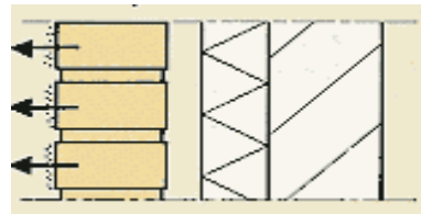
Water verdampt en de stoffen worden als witte uitbloei zichtbaar aan het oppervlak.