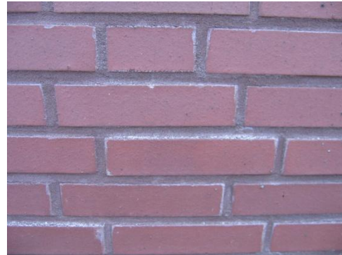
Smetranden door metselmortel

Metselwerk met een permanente waterbelasting (kademuren e.d.) dient eveneens tot boven de hoogste waterlijn te worden doorgestreken.