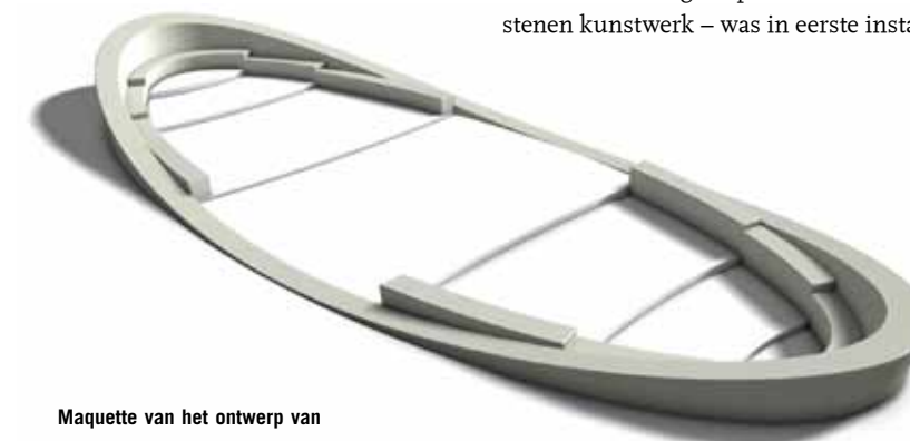
Maquette van het ontwerp van het Vikingschip.

“Het ontwerp is goed uit de verf gekomen”, meent Bastiaanssen. “We wilden op het Oranjeplein een baken van rust creëren. Het plein is een plek geworden waar men prettig kan verblijven maar waar ook van alles gebeurt. Het is mooi dat we dat hebben weten te bereiken, terwijl we ook dichtbij het oorspronkelijke ontwerp zijn gebleven. Zelfs de naam – Vikingschip – is overeind gebleven.” Niet toevallig overigens: het kunstwerk kenmerkt >