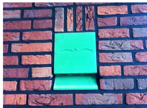
Opvallende prefab vleermuiskast in het buitenblad