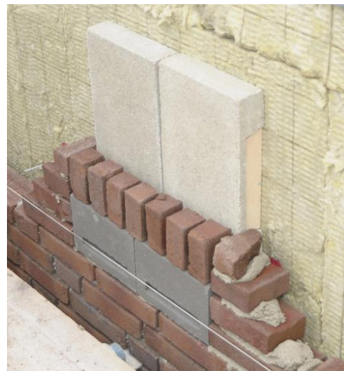
Inmetselen van prefab vleermuiskasten