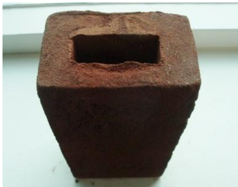
De vleermuissteen wordt vooral in het Verenigd Koninkrijk gebruikt

De brochure 'Vleermuisvriendelijk bouwen' is te downloaden via http://www.zoogdiervereniging.nl . De Zoogdiervereniging kan ook adviseren bij maatwerk.