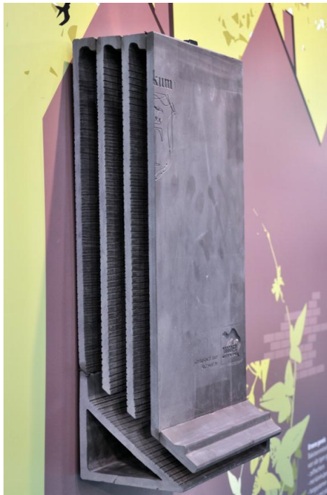
Keramische vleermuiskast (opengewerkt) voor inbouw in metselwerk. Gemaakt door Koninklijke Tichelaar op verzoek van de Zoogdierenvereniging